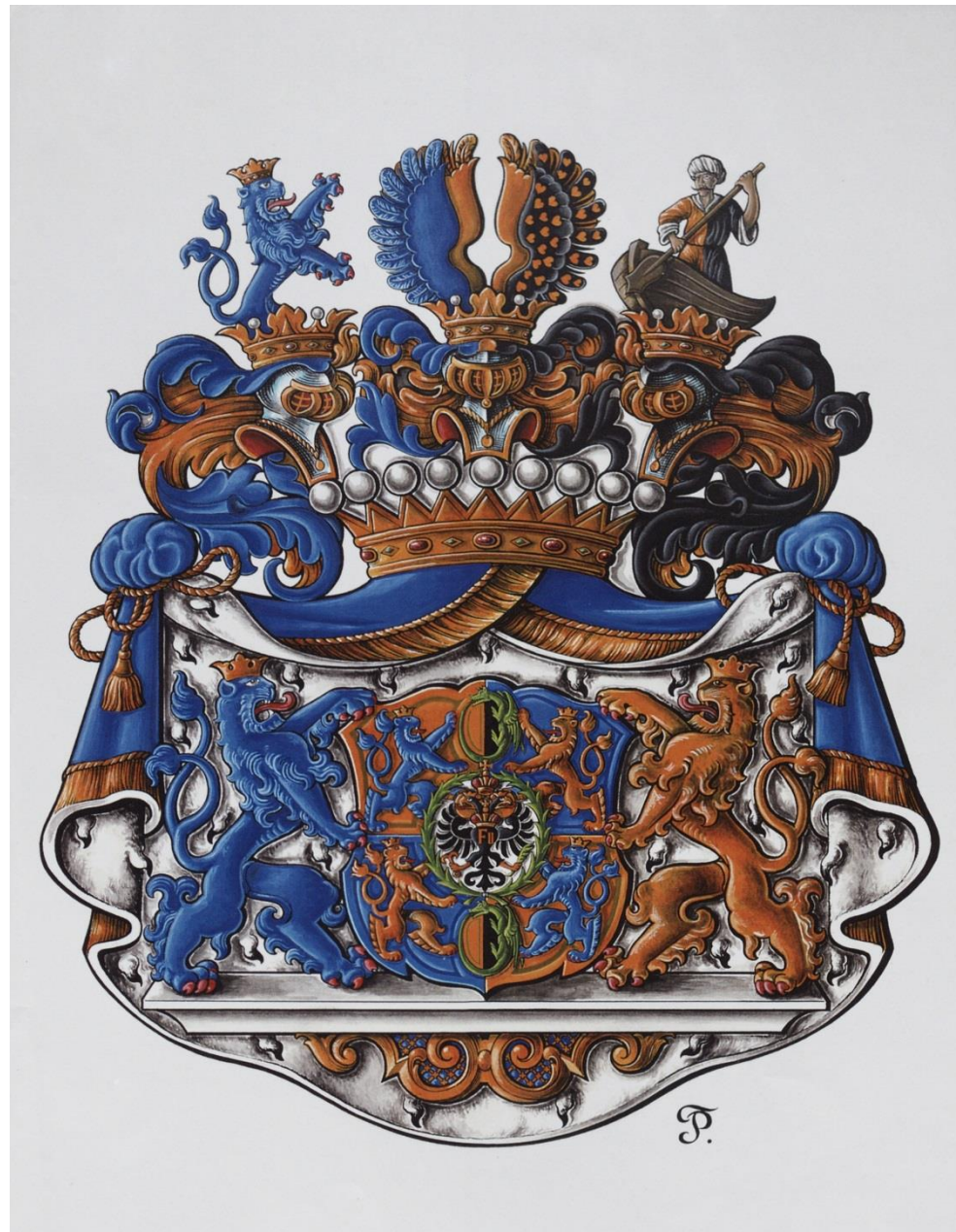
Erb hrabat z Valdštejna-Vartenberka z roku 1758

Držitelé Řádů: zlatého rouna, rakouského císařského Řádu Leopoldova I. třídy, vše vloženo do knížecího pláště s knížecí korunou.