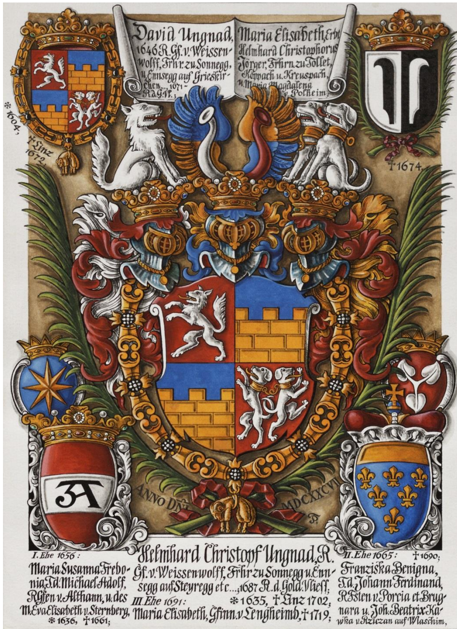
Erb Hrlmharda Kryštofa hraběte Ungnada z Weissenwolfu a Sunecku, pána na Vlašimi (*1635 +1702), rytíře Řádu zlatého rouna

V 90. letech minulého století opouští zaměstnání rytce a heraldice, genealogii a heraldické kresbě se věnuje již naplno. Vznikají jeho vrcholné práce. Kromě spolupráce s Klubem pro českou heraldiku, nebo Akademií heraldických nauk České republiky a publikační činnosti, zpracoval zakázky pro plejádu současných potomků šlechtických rodů spojených s českou zemí, stejně tak jako pro státní a regionální paměťové instituce, ale spolupracuje např. také s obcemi v oblasti obecních znaků