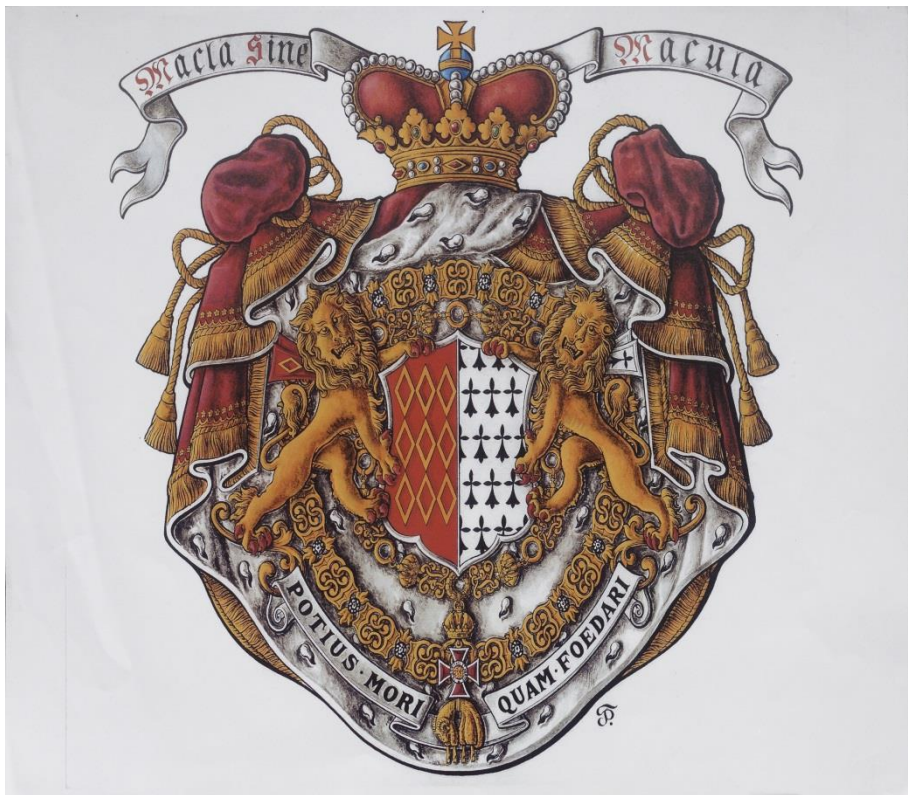
Erb knížat z Rohanu-Guemenné-de Rochefort

Držitelé Řádů: zlatého rouna, rakouského císařského Řádu Leopoldova I. třídy, vše vloženo do knížecího pláště s knížecí korunou.