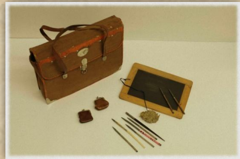
Břidlicová psací tabulka s jednou stranou červeně linkovanou, přelom 19. a 20. století, Čechy, Národní pedagogické muzeum a knihovna J. A. Komenského