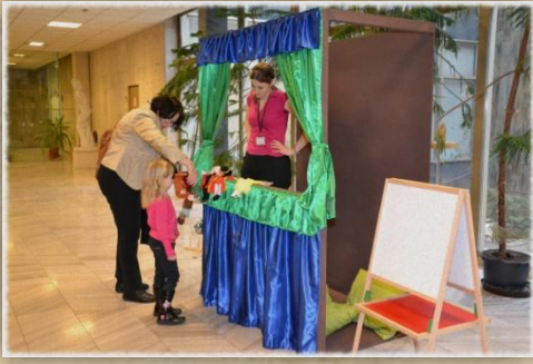
Zahrajte si pohádku!