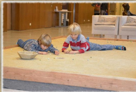
Cvrnkej do důlku!