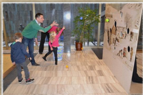
Stref se koulí!