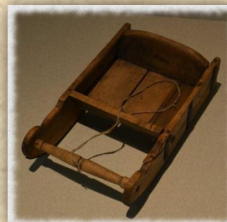
Dětské sánky, konec 19. Století, Čechy, Krkonošské muzeum v Jilemnici