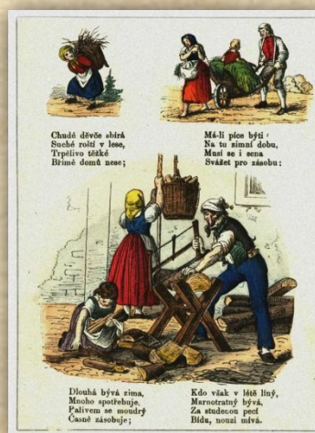
Hodně dětí muselo odmalička pracovat: doma, na poli, někdy i ve službě nebo v továrně.