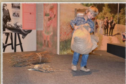
Představ si, že tvým úkolem je přinést dřevo na zatopení a zbytek dne pomáhat se sklizní.