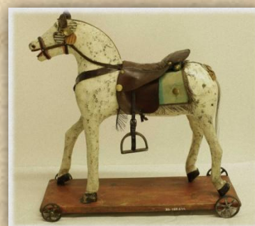
Kůň na kolečkách, počátek 20. století, Skašov (okr. Plzeň-jih), Národní muzeum