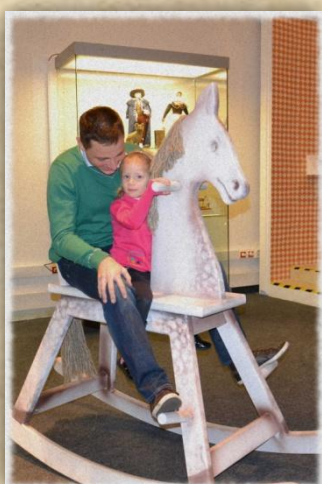
I máma i táta si mohou užít na houpacím koni.