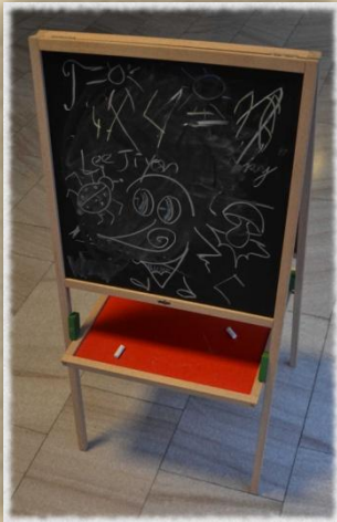
Umiš psát krasopisně?