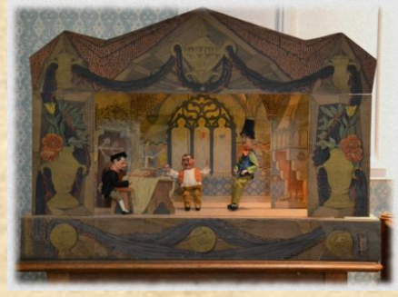
Rodinné loutkové divadlo se souborem dekorací a loutkami, 1913, Praha, Národní muzeum